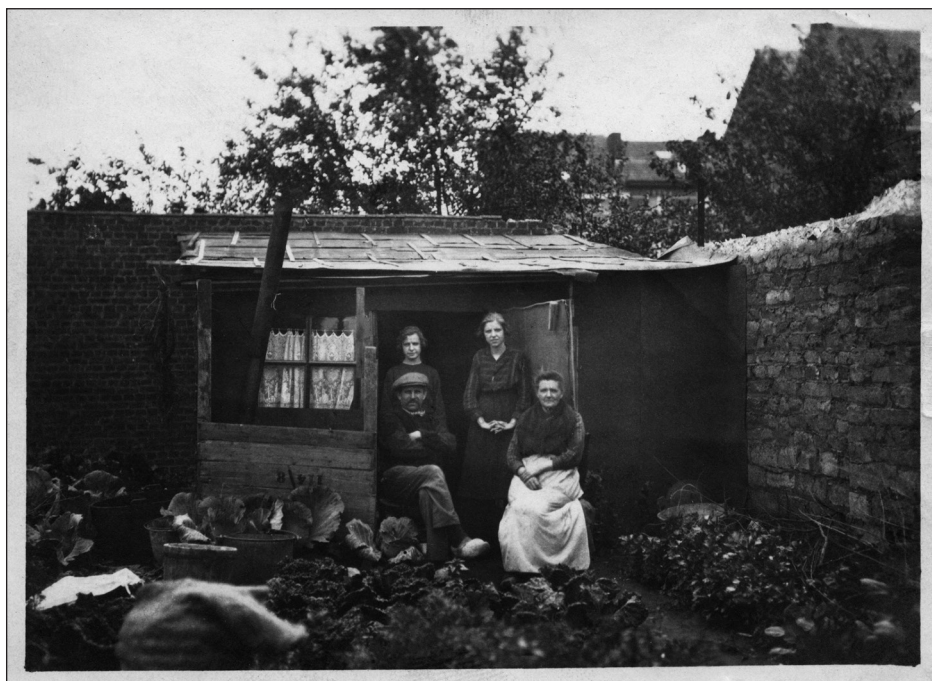
Woonomstandigheden in Aalst tussen 1930 en 1940. Een familie voor hun barak met groententuin aan de Zeebergbrug.

De nieuwe Nationale Maatschappij voor goedkope woningen en woonvertrekken zette enkele bouwprojecten op til, maar kende weinig succes. Inwoners van de nieuwe Bataviawijk te Roeselare vonden de huurprijs te hoog en de ruimtes te klein. 14 Er kwam ook behoorlijk wat weerstand van lokale politici, die gesubsidieerde woningbouw geldverspilling noemden. Sommige conservatieven noemden de nieuwe sociale tuinstad in Zelzate smalend "klein Rusland". Nochtans hadden de bewoners daar geen klachten. 15 Als we in het achterhoofd houden dat de regering al vanaf 1921 beknoptelde op de heropbouw, dan zijn die 300 miljoen premies uit 1924 extra opmerkelijk.