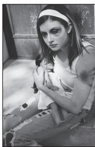
Fysiek geweld tegen een kind