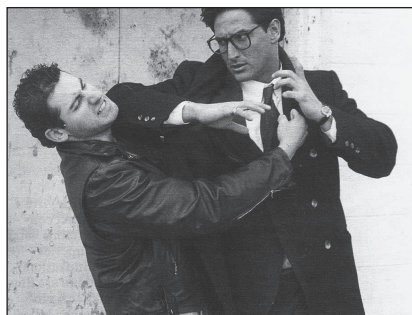
Gevecht tussen twee mannen